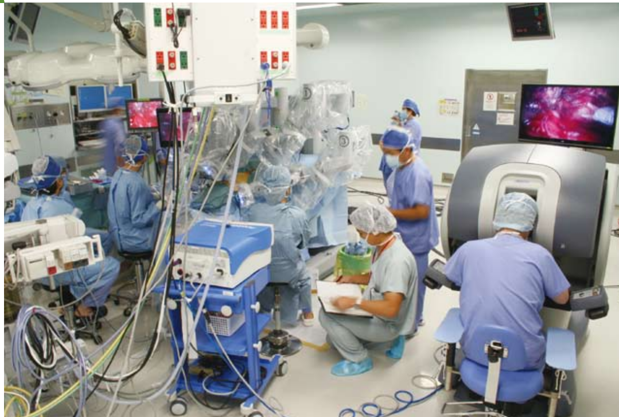
↑ 本院での前立腺がん全摘除手術 平成23年10月

なお、ロボット手術といっても「ダ・ヴィンチ」が自動で手術を行うわけではなく、医師がケーブルでつながったコンソール(操作台)に座り、内視鏡の3D(三次元)モニター画面を見ながらロボットアームを遠隔操作して、患部の切除や縫合などの手術を行います。